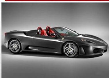
Со временем автомобили становились все ниже и ниже, их формы округлялись. Тем самым уменьшалось сопротивление воздуха. Благодаря этому автомобили могли двигаться быстрее и сжигали меньше горючего. Они крепче стояли на колесах и не качались при сильном боковом ветре. Появился специальный технический термин, обозначающий новую форму автомобилей, - «обтекаемый». В настоящее время все больше автомобилей имеют обтекаемую форму.