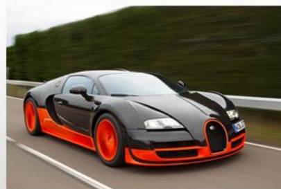
Инженеры изучали все компоненты автомобиля, чтобы спроектировать более мощные двигатели и механизмы. Инженеры улучшали колеса и шины и изменяли их размеры и материалы. Сегодня автомобили могут двигаться быстрее 400 км/час