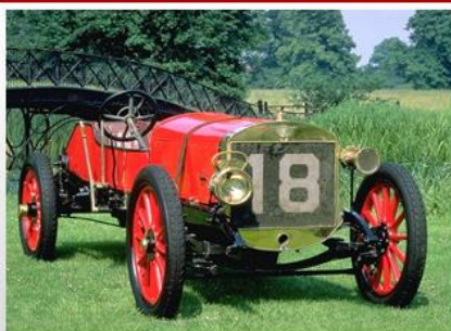
1908 год. Первые настоящие гоночные автомобили, созданные специально для гонок. У них были деревянные шасси и ездили они со скоростью примерно 100км/час.